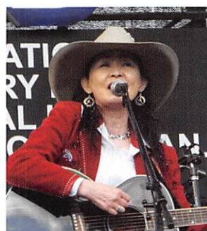
OLIVE (Guitar & Vocal)

還暦を過ぎ、仕事から解放されてカントリーを再勉強し直しました。ゲスト出演などで経験を積み、5年前からは自身のライブ・コンサートで熱演しております。昨年・今年とラジオ関西の番組にも出演しました。特にスロー・バラードを得意としております。