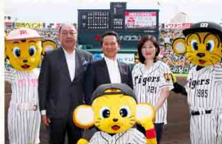
グンゼ時代 始球式