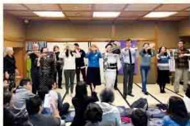
35周年記念パーティー