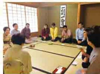
緑の館でのお茶会