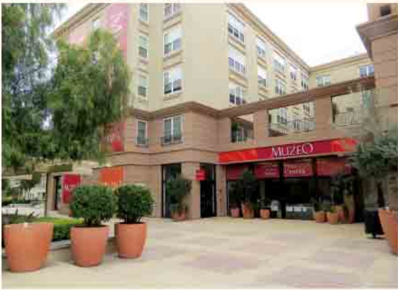
アナハイム図書館遺産センター