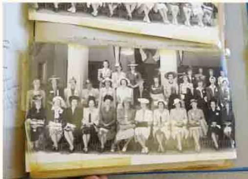
出席者のレディとしての 服装をご覧ください。