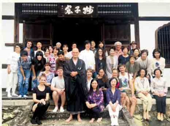
天龍寺での座禅大会

35年という長い活動歴の中、1997年には京都新聞社国際交流賞を受賞、1999年には英国ケンブリッジ大学ペンブルックカレッジ聖歌隊の京都公演を主催、20周年記念として加茂川会に参加されていた外国のアーティストによる作品展を開催。