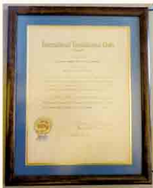
アーネステイン・ホワイト女史の サンフランシスコクラブの認証状 (charter No.1)