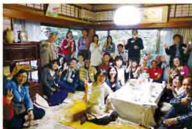
大八木邸での桜パーティー