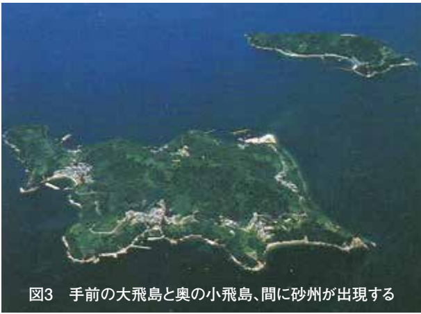
図3 手前の大飛島と奥の小飛島、間に砂州が出現する

2代秀忠・3代家光将軍期に徳川大坂城として再建する際の石垣材として多用され、刻印が残る。現在も海面下70mを超えて掘り進められる採石場が独特の景観を見せる。