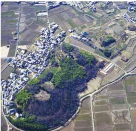
図4 造山前方後円墳と千足装飾古墳などの陪塚、岡山市

鎌倉新仏教、浄土宗の開祖法然は、美作稲岡荘漆間（うるま）氏の生まれ。その誕生の地に建つのが重文の御影堂と山門の残る誕生寺。ここでも4月第3日曜日（元は旧暦4月19日）に阿弥陀二十五菩薩練供養が行われ、法然の父母の供養が合わせ挙行される。一方、茶祖ともされる（二度目の入宋の1187～1191年、茶の種子を持ち帰り、平戸と肥前で栽培、京都の明恵に種を贈る、実際の最初は鑑真）臨済宗の開祖栄西は、備中一宮の