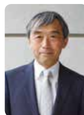
谷一尚氏 たにいち・たかし

古墳時代では、岡山市新庄下の造山古墳（墳長360m、日本第4位、5世紀初、周辺に陪塚の小古墳6基、うち一つが凝灰岩製切石前面の直弧文と上面の鍵手文で著名な千足装飾古墳、図4）、総社市三須の作山古墳（吉備路自転車道が岡山市伊島からここを通る、墳長286m、日本第9位、5世紀中葉）がある。いずれも前方後円墳で、かなり大規模ではあるが、第1位の仁徳天皇陵古墳など畿内の大規模古墳が平坦地から築き上げているのに対し、これら吉備の大規模墳は山地を利用しており、単純比較はできない。（以下、次号）