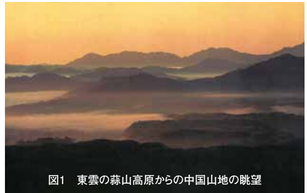
図1 東雲の蒜山高原からの中国山地の眺望

1万2千年前には最後の氷河期が終わり、温暖化により海面が上昇。関門、淡路の両側から海水が流入し、現在に近い瀬戸内海が出現。ヨットハーバーやオリーブ園で著名な瀬戸内市牛窓沖の黄島