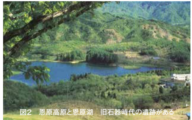
図2 恩原高原と恩原湖 旧石器時代の遺跡がある