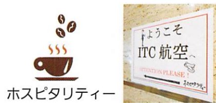
ホスピタリティー