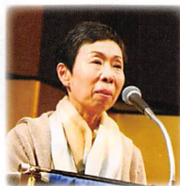
インスピレーション