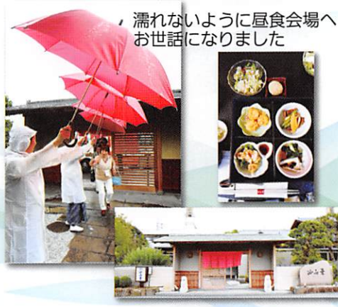
濡れないように昼食会場へお世話になりました