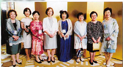
35期役員 レシービングライン (立礼)