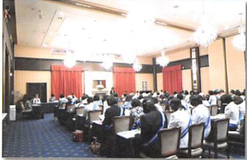
派遣員ブリーフィング