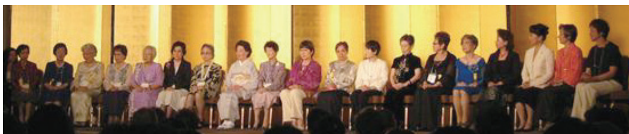
歴代日本リージョン会長