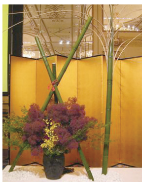
節目の年、華麗に竹のように すくすくと未来を切り開いて!